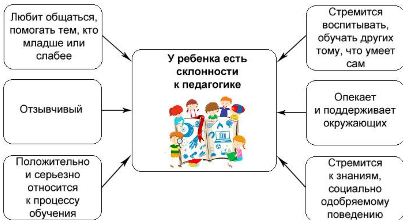
Рисунок 2. Какие качества ребенка могут говорить о его склонности к педагогике

Темперамент, характер и способности школьников влияют на их учебную мотивацию.